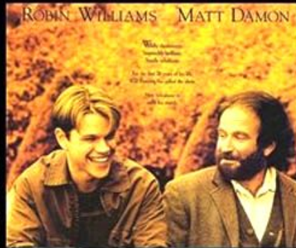
What I think I do