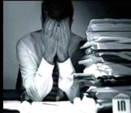
What I really do