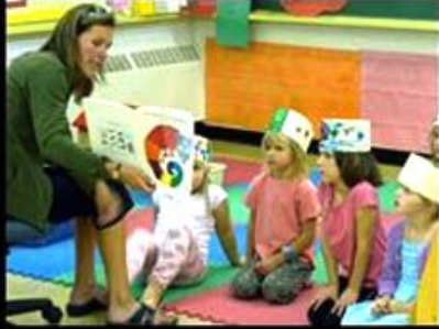
What my friends think I do