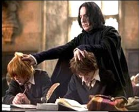
What kids think I do