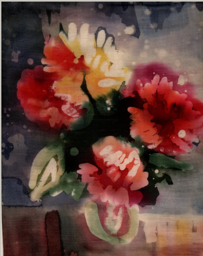
Рисунок на ткани Горячий батик