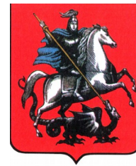
Современный герб Москвы