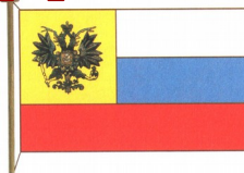
Флаг 1914 г.

Американцам так понравилась эта и остальные девять первых поправок к Конституции, что они вот уже двести лет оставляют эти тексты без изменений.