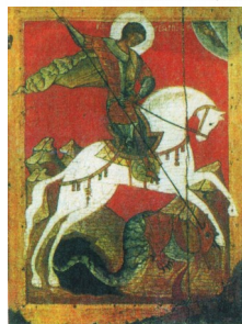
Икона XV в. «Чудо Георгия о змие»