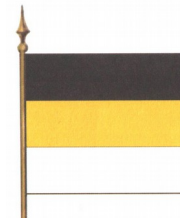
Государственный флаг 1858 г.

7 октября 1977 г. на внеочередной 7-й сессии Верховного Совета СССР 9-го созыва была принята третья (брежневская) Конституция СССР, отражавшая процесс превращения государства «диктатуры пролетариата» в так называемое общенародное социалистическое государство, при сохранении реальной власти в руках партийно-советской номенклатуры.