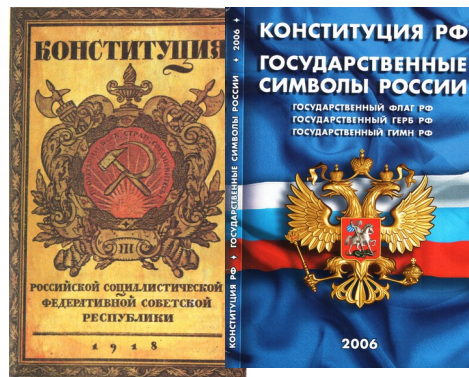
Обложка первой советской Конституции. 1918 г.