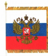
Стандарт президента Российской Федерации