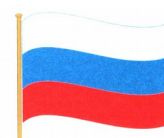
Современный государственный флаг Российской Федерации