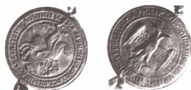
Печать Ивана III 1497 г.