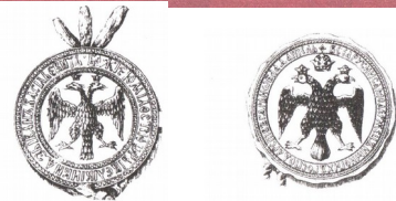
Печать Михаила Федоровича 1625 г.

КОНСТИТУЦИЯ (от лат. constitutio – установление) – Основной Закон государства, определяющий основы общественного и государственного строя, систему органов власти, порядок их образования и деятельности, права и обязанности граждан. В соответствии с Конституцией формируется все законодательство государства.