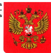
Современный государственный герб Российской Федерации