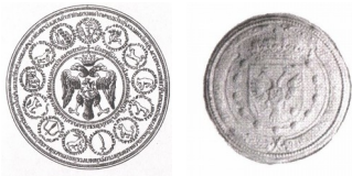
Печать Петра I

КОНСТИТУЦИЯ (от лат. constitutio – установление) – Основной Закон государства, определяющий основы общественного и государственного строя, систему органов власти, порядок их образования и деятельности, права и обязанности граждан. В соответствии с Конституцией формируется все законодательство государства.