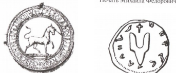
Печать Ивана IV с единорогом