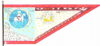
«Великий стиг» Ивана Грозного