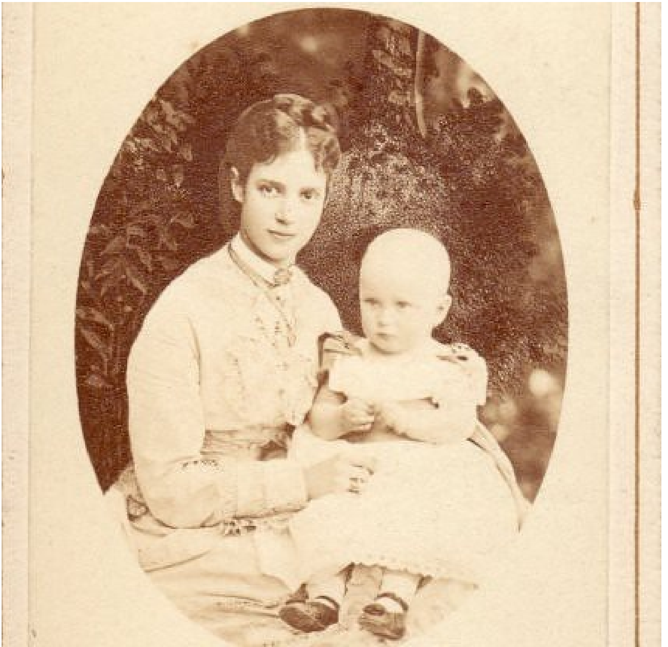
Цесаревич Николай Александрович с матерью, Цесаревной Марией Феодоровной. 1869 г