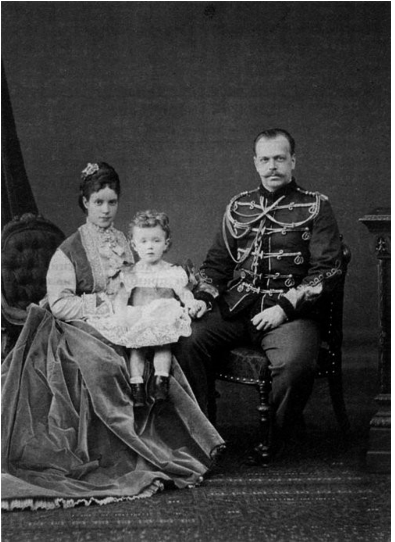
Цесаревич Николай Александрович с отцом, Цесаревичем Александром Александровичем и матерью, Цесаревной Марией Феодоровной. 1870 г?