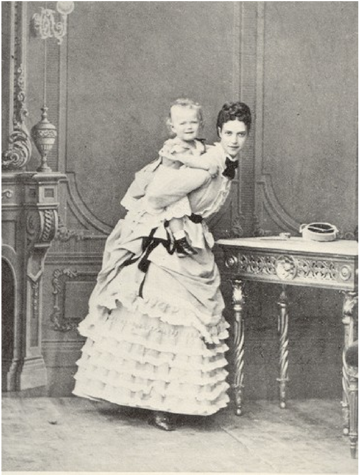
Цесаревич Николай Александрович с матерью, Цесаревной Марией Феодоровной. 1869 г Снимок можно увеличить