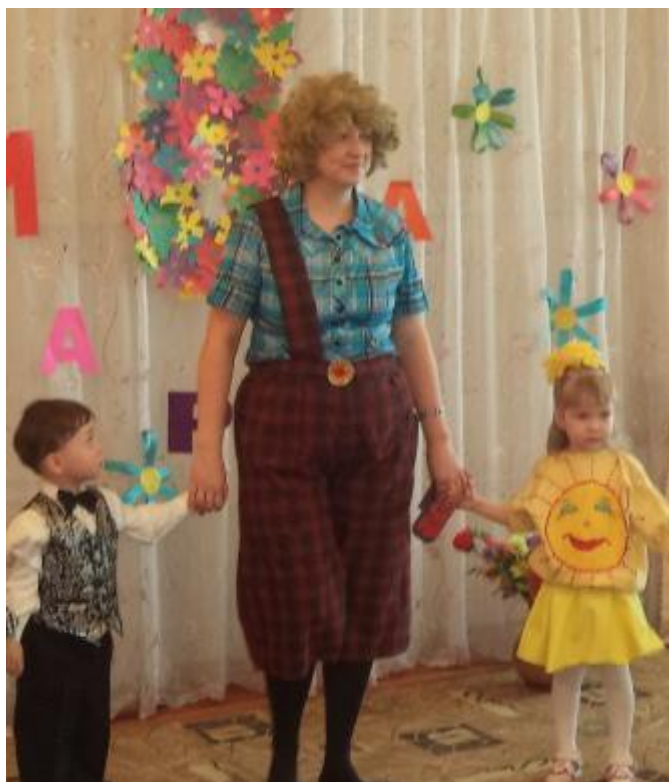
Фото 3. Карлсон в гостях у детей