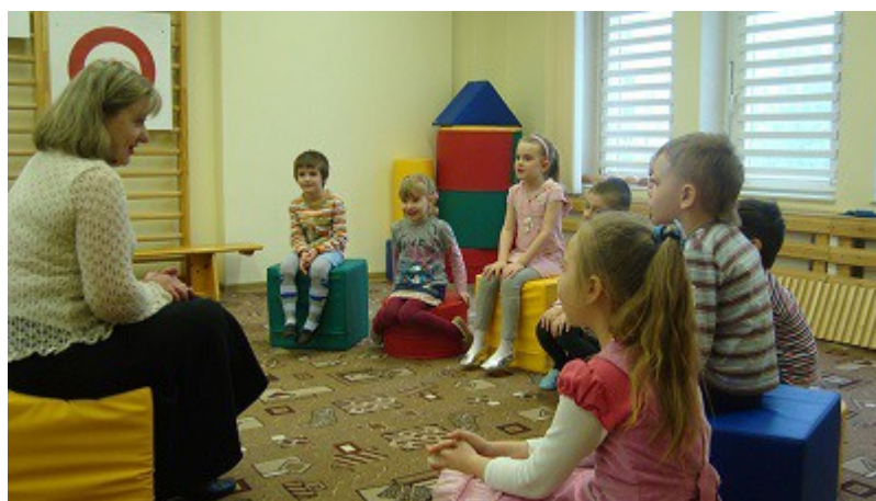
Фото 4. Педагог-психолог беседует с детьми