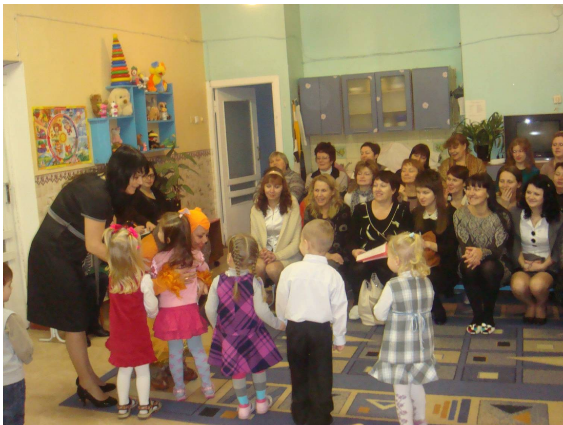
Фото 2. Совместный досуг родителей и детей