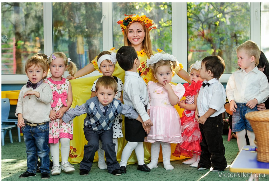
Фото 1. Путешествие в Страну Вежливости