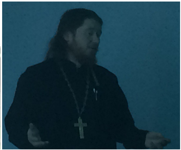
Акция «Помощь старикам»