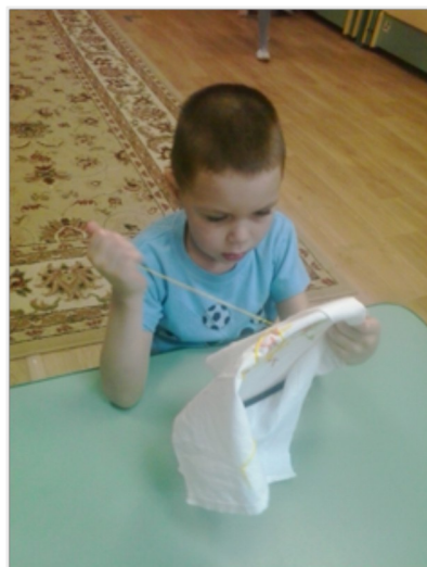
г. Рязань 2018 год