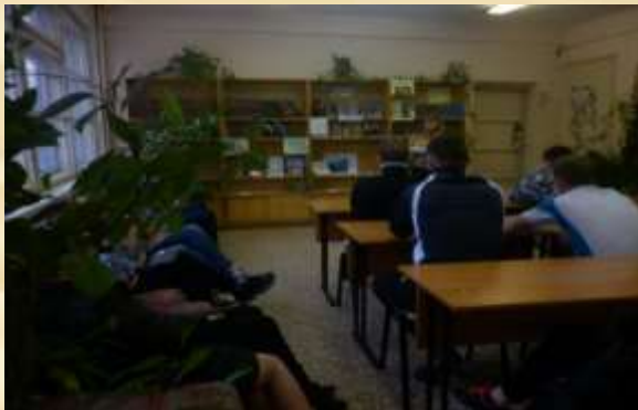
Заседание Совета общежития