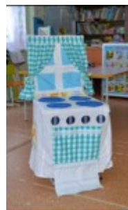
Чехол на стул — кухня

Работа по реализации проекта проводится в три этапа: