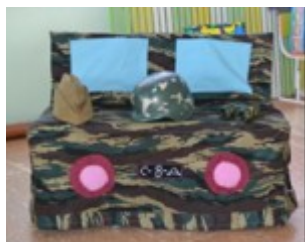
Чехол на стулья — военная машина