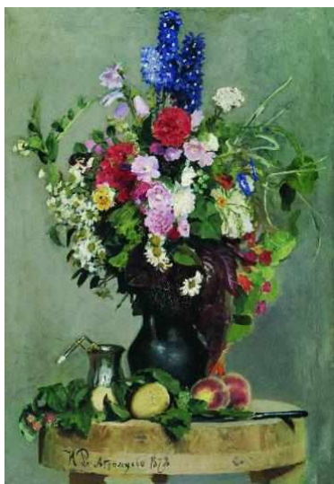
Букет цветов, 1879

знающих лиц, он пользовался всяким случаем, чтобы рисовать: сидит ли он на каком-нибудь заседании, беседует ли с приятелем или знакомым на улице – всюду он зарисовывал в альбом или на лист бумаги. Работая над картиной или портретом, он опять попутно рисовал; искал на бумаге карандашом наиболее совершенного выражения своей идеи. Работы живописца – ярчайшее явление в мировой культуре.