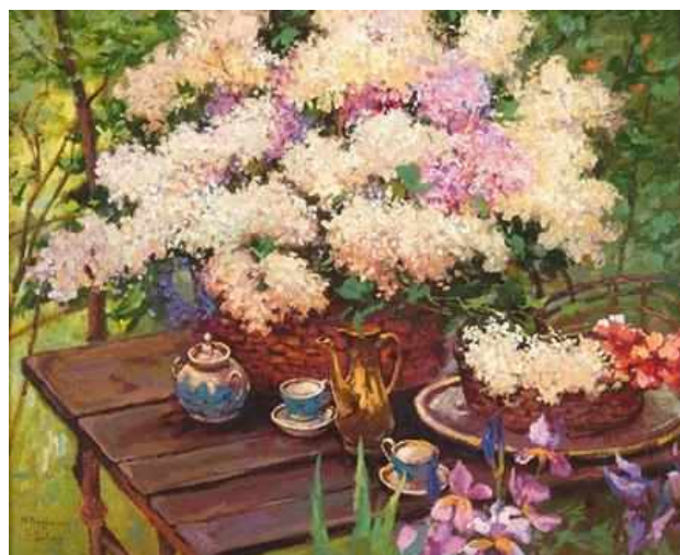
Натюрморт с гортензиями и ирисами, 1930-1940

Художник использовал богатые композиции, в каждой из которых любой детали и цветовому решению уделяется максимум внимания, что делает натюрморт очень живописным.