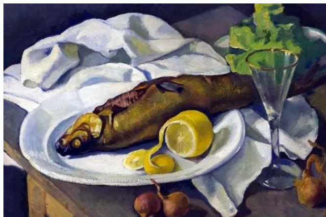
Селедка и лимон, 1923

Работа Серебряковой «Атрибуты искусства» имеет традиционную для художника композицию. Как это принято на произведениях с подобным названием, здесь изображена античная маска, присутствует ящик с красками, рулон бумаги, напоминающий свиток, на втором плане расположились стеклянные бутылочки с порошками-пигментами для красок и светлая керамическая ступка. Натюрморты на «производственную тему» часто встречаются в творчестве художников.