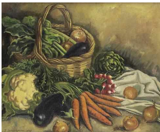
Натюрморт с овощами, 1936

Следующий, более скромный натюрморт называется «Селедка с лимоном». Здесь заметна некоторая ирония: лимон очищен, кожица спускается спиралевидной стружкой – претензия на аристократизм, в то время как рядом с ним селедка, совсем уж простая рыба. Но и в этом полотне – поэзия и красота повседневной человеческой жизни.