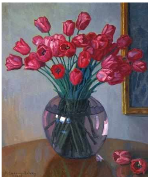
Натюрморт с тюльпанами, 1935

Художник использовал богатые композиции, в каждой из которых любой детали и цветовому решению уделяется максимум внимания, что делает натюрморт очень живописным.