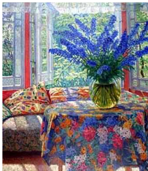
Ваза с цветами в зимнем саду, 1935

Зинаида Евгеньевна Серебрякова (1884-1967) — русская художница, одна из первых русских женщин, вошедших в историю живописи. Уже к 25 годам она стала всемирно известной. В русском искусстве начала XX столетия трудно найти другого художника, чье видение мира было бы так безмятежно-радостно, так исполнено веры в светлые истоки жизни. Избежав соблазна «новейшими» течениями и направлениями, возникавшими на изломе веков, Серебрякова в своем творчестве сохранила верность тем классическим традициям, в которых была воспитана. Её кисти принадлежат ещё многие полотна, менее известные, но не менее чудесные. В жанре натюрморта у Зинаиды Серебряковой мало известных работ, в творчестве художницы он появляется уже в зрелом возрасте. Может, она действительно редко писала натюрморты, а может