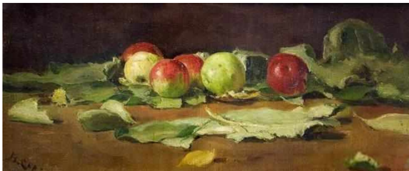
Яблоки и листья, 1879

Николай Петрович Богданов-Бельский (1868-1945) — великий русский художник конца XIX — первой половины XX веков, мастер портретного и бытового жанров. Николай Богданов-Бельский также писал сельские пейзажи, а главными героями его картин чаще всего были простые крестьяне. Но в его творчестве также есть и натюрморты. Этот художник-передвижник смог выбиться в люди вопреки бедняцким условиям жизни и благодаря своему таланту, проявившемуся уже в раннем детстве. Николай Петрович отличался трудолюбием и сильным духом, что позволило ему занять достойное место среди русских художников стыка эпох.