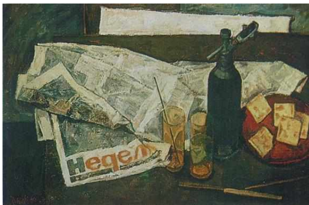
Натюрморте с «Неделей», 1966

Художник на одной картине показал целую жизнь первой советской чемпионки мира в конькобежном спорте — Марии Исаковой. С кубками, за каждым из которых — годы тренировок; медалями, которые доставались в упорной борьбе; письмами и огромными букетами.