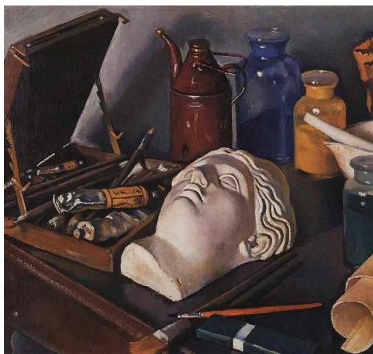
Атрибуты искусства, 1922

быть, они быстро продавались на аукционах и нам теперь недоступны, но некоторые все же хранятся в открытом доступе.