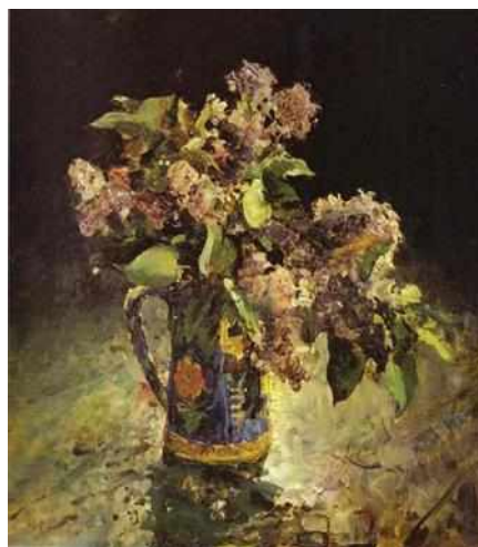
Сирень в вазе, 1887