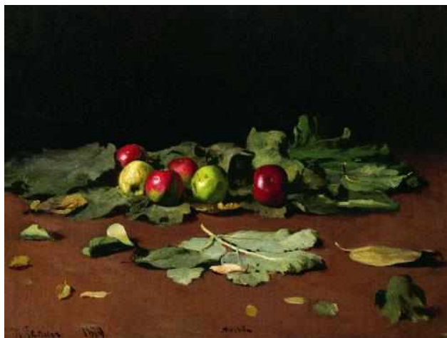
Яблоки и листья, 1879

О картине Ильи Репина Яблоки и листья , написанной в 1879 году, сохранилась история о том, что Репин выложил собранные на земле яблоки и листья для своего ученика Валентина Серова. Но полученная на столе картинка так впечатлила художника, что он тоже взялся за кисть.