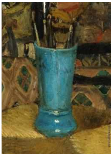
Синяя ваза с кистями, 1875

изумительной достоверностью. Вся жизнь художника проходила в непрерывном поиске новых направлений и решений в изобразительном искусстве. Он не желал повторять удачно найденных приемов и способов, всегда стремился ко всему новому и еще не опробованному. Работы талантливого мастера не ограничивались одними портретами: он создавал жанровые картины, исторические иллюстрации, работы на мифологические тему и конечно натюрморты. Картина Серова получилась поменьше размером, так как он взял более близкий угол зрения и сократил передний и задний фон до минимума. По одним источникам картина Серова называется «Яблоки и листья», по другим «Яблоки на листьях».