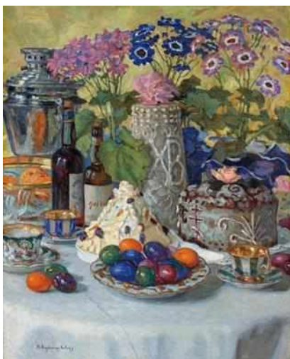
Пасхальный стол, 1916