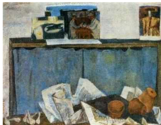
Натюрморт с горшочками, 1968

Алексей Тихонович Антонов (1932 —2005) — современный русско-американский художник, увлекался классической живописью. Его основное направление — классический реализм, творческий процесс в живописи с четкими правилами и требованиями, которые были созданы великими художниками эпохи Возрождения и позже «отполированы до блеска» многими последующими поколениями художников. Алексей Антонов хотел оживить и расширить методы великих мастеров эпохи Возрождения и возглавить новый