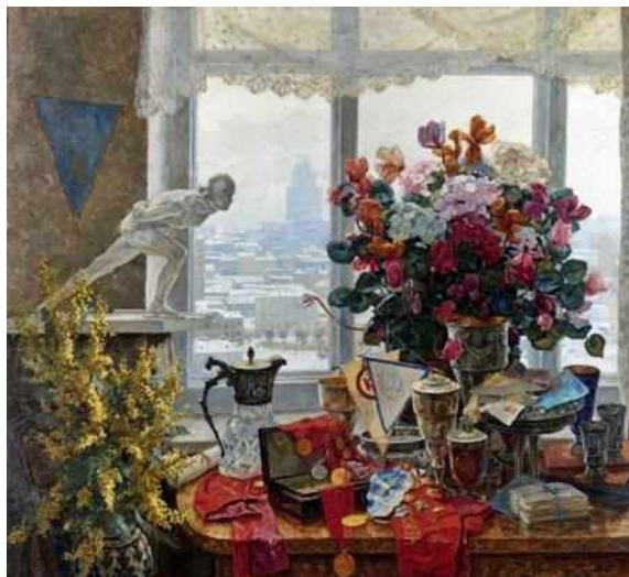
Этюд с медалями, 1951