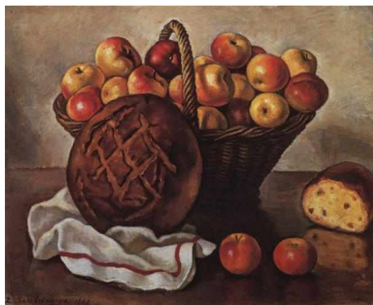
Натюрморт с яблоками и круглым хлебом, 1948

Анатолий Юрьевич Никич-Криличевский (1918–1994) – выдающийся советский художник, живописец. Еще при жизни признанный профессионалами «современным классиком». Натюрморт позволял Никичу отказаться от